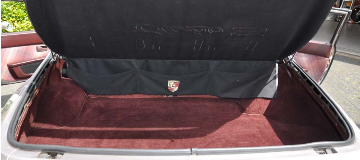
Kofferraum sauber ohne Korrosionsansätze