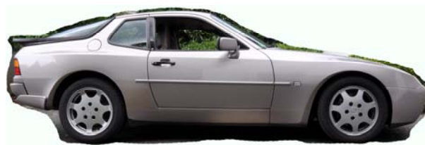
Porsche 944 Turbo S (Sonderserie)