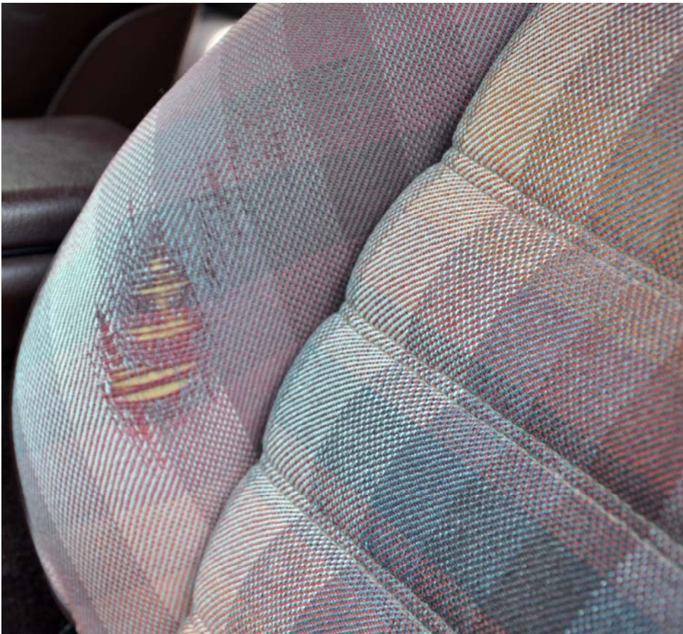
Stoffbezug der Sitzwanne des Fahrersitzes defekt (Ersatzstoff laut Halter vorhanden)